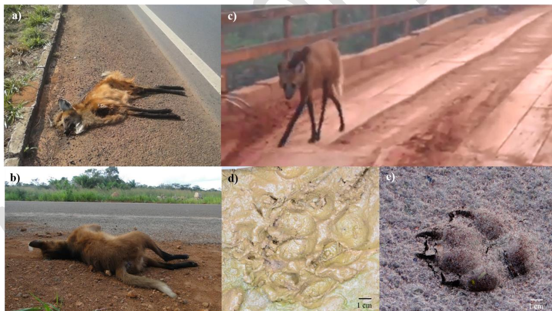
Figura 1. Registros de atropelamento (a-b), observação direta – imagem capturada de vídeo © e pegadas (d-e) do lobo-guará ( Chrysocyon brachyurus ; Carnivora, Canidae) na porção limítrofe noroeste de sua distribuição geográfica na Amazônia brasileira.

venaticus ) pelo tamanho ( i.e. , a proporção das pegadas; Figura 1d-e), e por sua configuração. A pegada do lobo-guará possui quatro dígitos levemente afastados e uma almofada pequena, apresentando dígitos maiores que o tamanho da almofada palmar (Carvalho & Luz 2008). Apesar de poder ser confundida, por exemplo, com a pegada da onça-parda ( Puma concolor ; Carnivora, Felidae), a pegada do lobo-guará apresenta as marcas das unhas (Figura 1d-e), o que auxilia na identificação da espécie. Além disso, a marca da pegada das patas anteriores é maior quando comparada às posteriores (Carvalho & Luz 2008). Por fim, apesar da presença de cães domésticos nas áreas de estudo (T. Cavalcante, observação pessoal), as pegadas do lobo-guará possuem dígitos maiores que o tamanho da almofada palmar, enquanto as de cães domésticos possuem uma almofada palmar grande, mas com dígitos pequenos, facilitando a diferenciação entre as espécies.