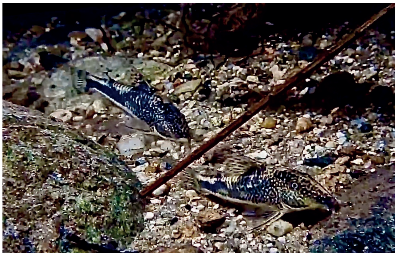
Figura 3. Exemplares de Scleromystax barbatus no seu ambiente natural.

independentes (Costa 1987, Sabino & Castro 1990), e dois outros pertencentes à bacia de drenagem do alto rio Paraná (Uieda 1983, 1984, Castro & Casatti 1997), todos localizados na região sudeste do Brasil, cuja ictiofauna é a melhor conhecida