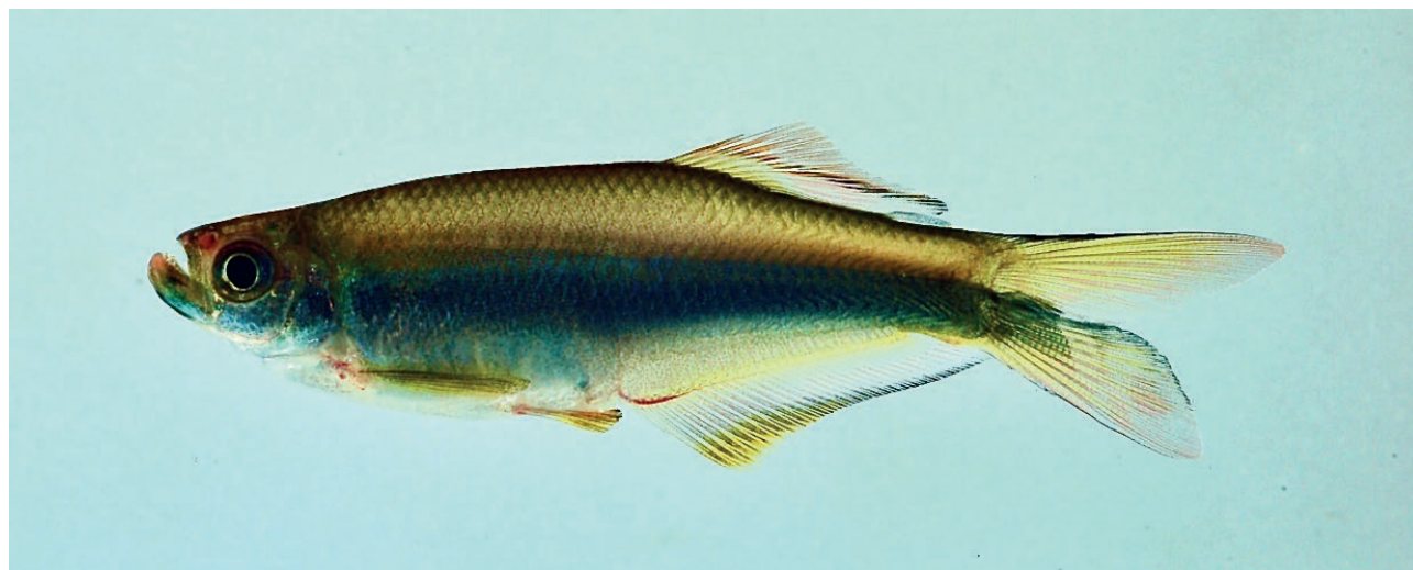
Figura 2. Exemplar de Mimagoniates microlepis (Characiformes, Characidae) em aquário, no campo.

Figure 2. A specimen of Mimagoniates microlepis (Characiformes, Characidae) in an aquarium field photograph.