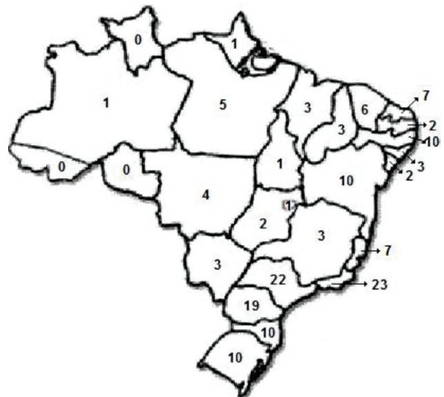
Figura 1. Mapa do Brasil mostrando o número de espécies bentônicas introduzidas em cada estado.

Em praticamente todos os estados brasileiros há registros de invasões biológicas (Figura 1). No estado do Rio de Janeiro, 23 espécies foram identificadas (sendo apenas uma de água doce), seguido pelo estado de São Paulo (22 espécies, sendo cinco de água doce), ambos na região Sudeste. Na região Sul, 19 espécies foram identificadas no estado do Paraná (4 de água doce e 15 marinhas). Outras 20 espécies foram identificadas nos estados da Bahia (10 espécies, sendo 9 marinhas) e Pernambuco (10 espécies, sendo 9 marinhas) na região Nordeste. No estado de Mato Grosso foram introduzidas quatro das seis espécies de água doce (Figura 1). Na maioria desses estados são encontrados os principais portos brasileiros que recebem diariamente um grande número de embarcações vindas de todo o mundo (ANTAQ 2007). Porém, o número de pesquisadores atuando nos grandes centros como São Paulo, Rio de Janeiro e Paraná também pode influenciar este cenário.