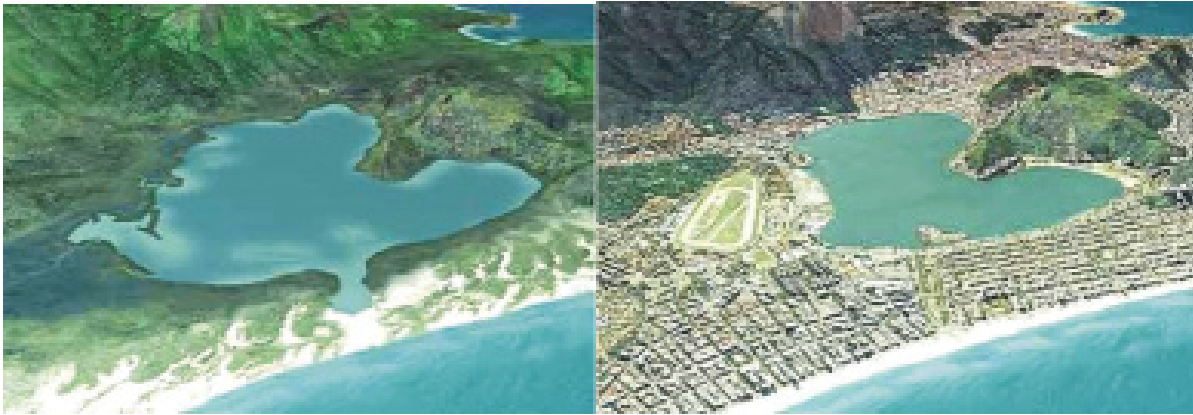
Figura 2. Desenho do entorno da Lagoa Rodrigo de Freitas natural e urbanizada (montagem a partir de fotos de Alma Carioca 2008).

Figure 2. Drawings of the surroundings of the Rodrigo de Freitas lagoon in its natural and urbanized stages (assembled from photos taken from Alma Carioca, 2008).