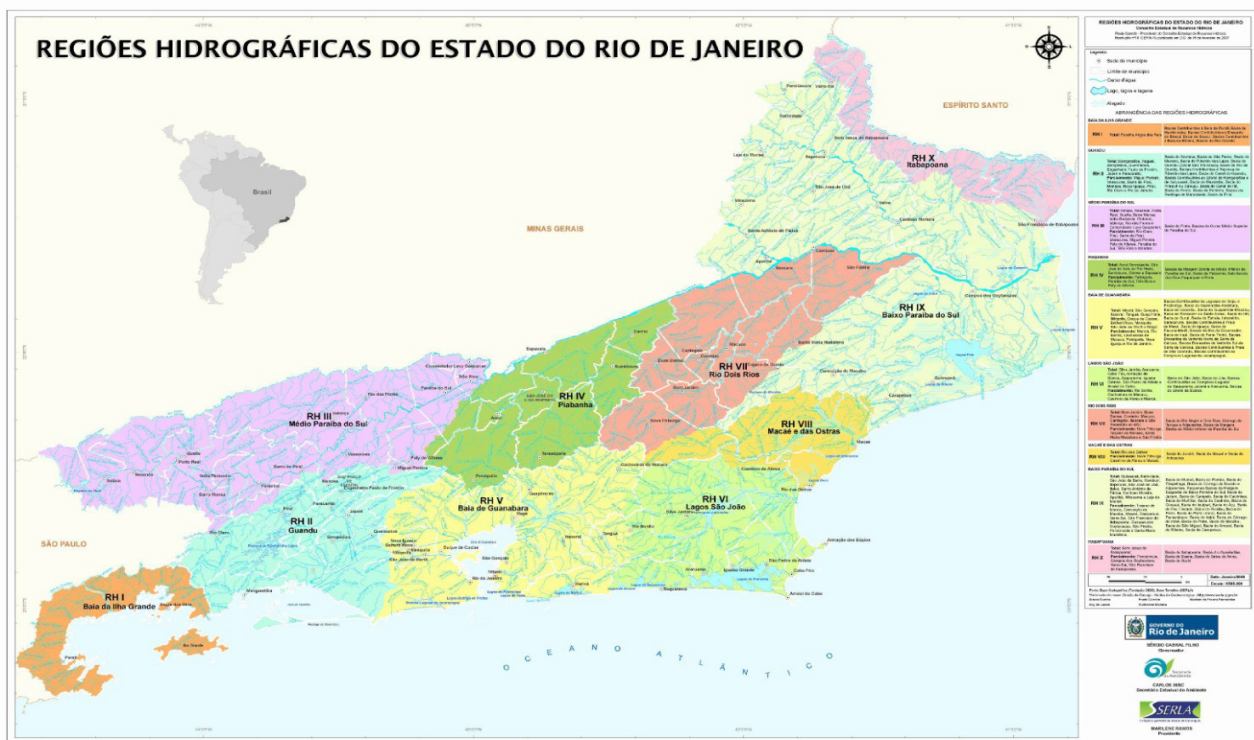
Figura 4. Regiões Hidrográficas do Estado do Rio de Janeiro.

hidrográficas, através da Resolução do CERH-RJ n.º18 de 08 de novembro de 2006 (Rio de Janeiro 2006). A divisão tem por objetivo facilitar a gestão dos recursos hídricos do estado e otimizar a aplicação dos recursos financeiros arrecadados com a cobrança pelo uso da água em cada região, sendo elas: Baía de Ilha Grande, Guandu, Médio Paraíba do Sul, Piabanha, Baía de Guanabara, Lagos São João, Rio Dois Rios, Macaé e das Ostras, Baixo Paraíba do Sul e Itabapoana (Figura 4) (SERLA 2008).