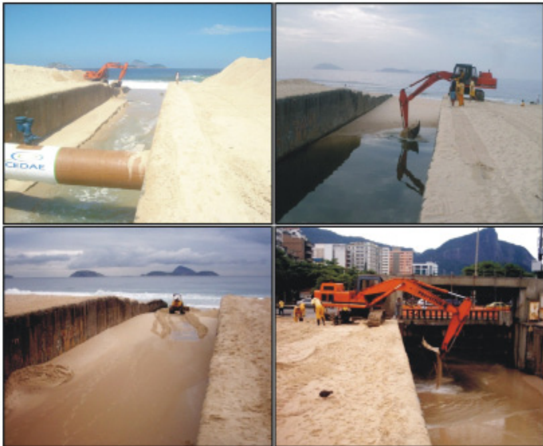
Figura 3. Máquinas desobstruindo o canal do Jardim de Alah. Figure 3. Working machines in channel of "Jardim de Alah".

sufocada. Sua operação ocorre tanto para promover a entrada de água do mar na lagoa quanto para controlar artificialmente seu nível de água. A foz desse canal é sistematicamente obstruída por areias transportadas pelas ações das vagas e correntes a elas associadas, assim como pela ação dos ventos, razão pela qual necessita ser permanentemente dragada (Figura 3), servindo este processo para permitir a circulação de suas águas entre os ambientes lagunar e marinho (Alves et al. 1998). Devido à ineficiência das trocas Lagoa-mar, há um acúmulo de materiais em suspensão e matéria orgânica que aí aportam (FEEMA 2008b).