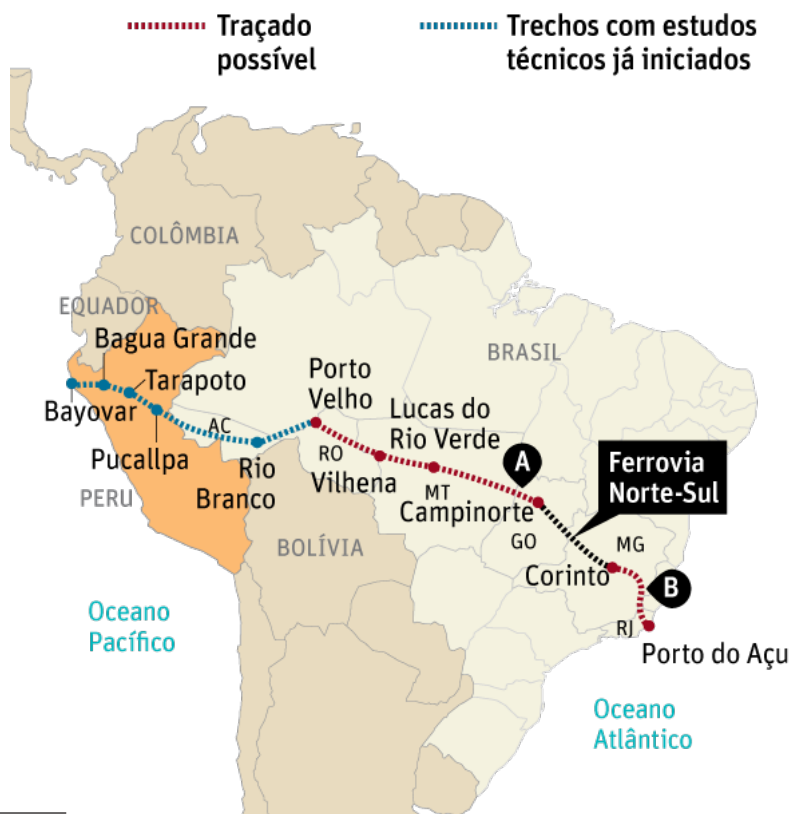
Mapa 1: Trecho em Estudo para a Execução da Ferrovia Bioceânica

Apesar da insistência do governo brasileiro, os chineses não pretendem investir no projeto como um todo, e sim, somente a partir de Campinorte/Goiás, conectando-se com a já existente Ferrovia Norte-Sul e terminando em Bayovar, ao norte do Peru 1 . Dessa forma, a intenção do Brasil de iniciar a ferrovia a partir do Porto de Açu/RJ não foi concretizada (MORAES, 2015). Em 2014, foi estabelecida uma comissão trilateral Peru-China- Brasil para realizar os estudos de viabilidade técnica do projeto, a qual contratou a empresa China Railway Eryuan Engineering Group Co. (CREEC) para a sua realização. A projeção feita é de que, inicialmente, a Ferrovia tenha capacidade para transportar 23 milhões de toneladas, com previsão de aumento para 53 milhões em vinte e cinco anos. De acordo com Amora (2016, p. 1), “isso equivale a levar 37% da carga da região do Mato Grosso ao país vizinho”.