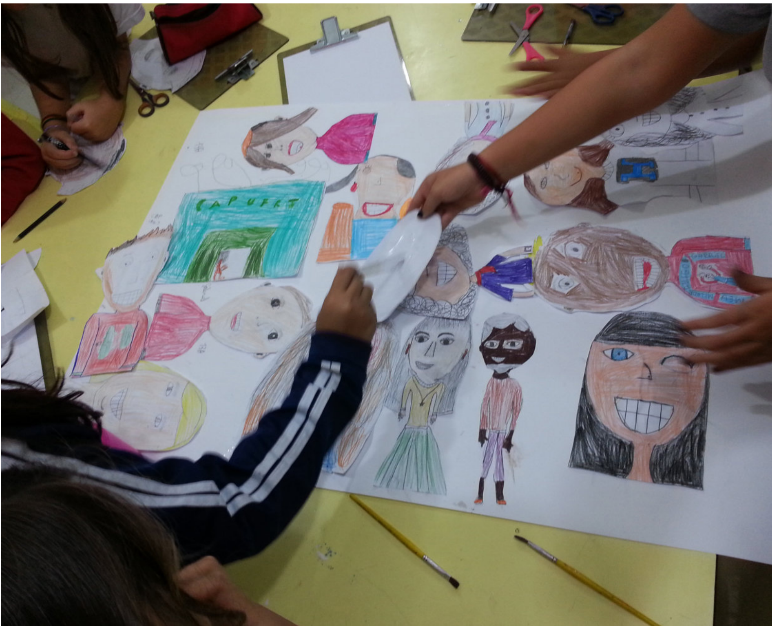
Desenho de observação da comunidade escolar- 3º Ano do Ensino Fundamental- 2015