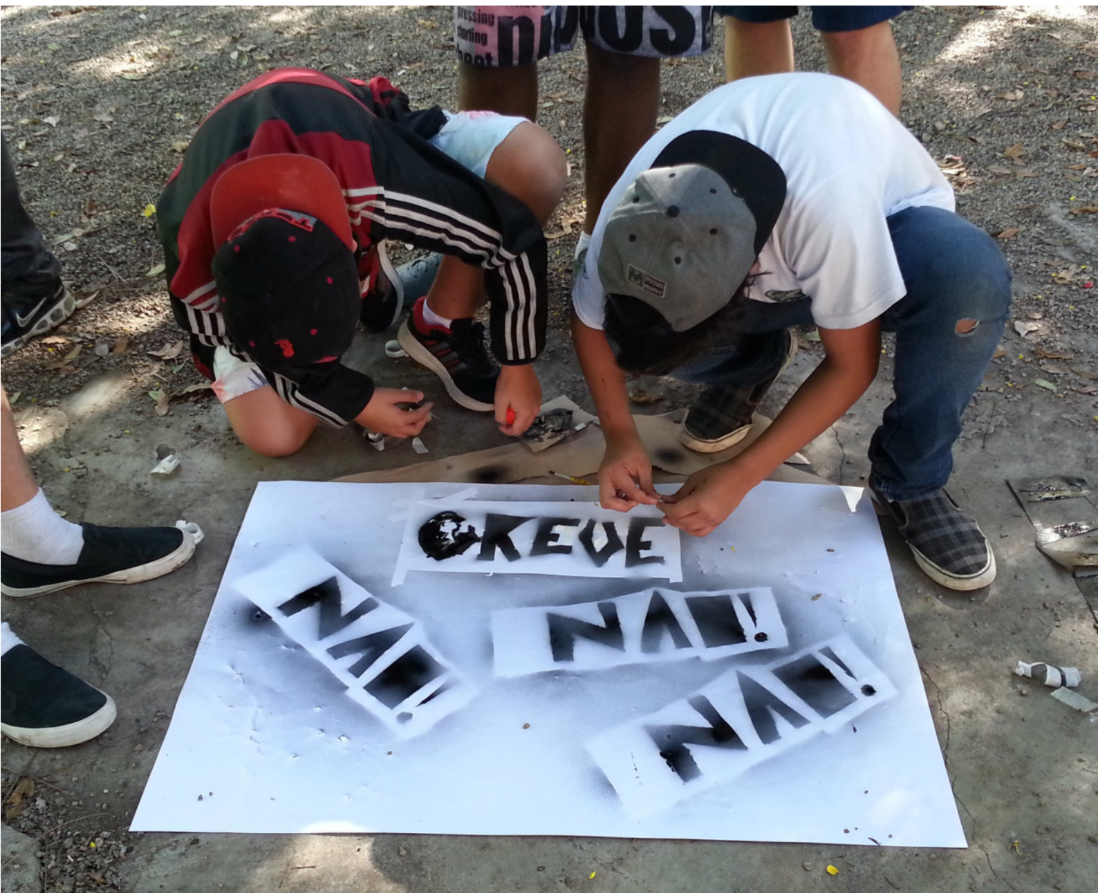
Trabalho-protesto realizado após o debate sobre a greve iminente - 8º Ano do Ensino Fundamental - 2015 191