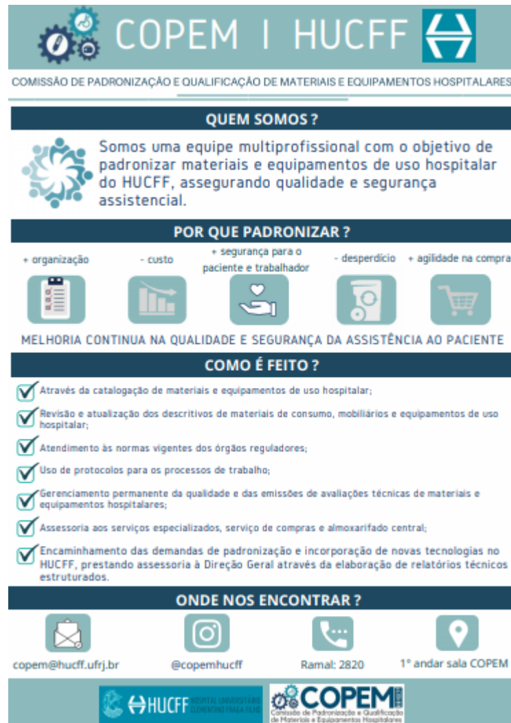
Figura 2: Exemplo de infográfico produzido na COPEM