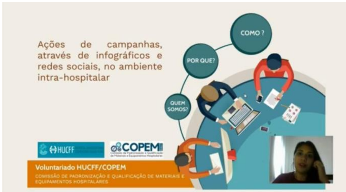
Figura 4: Captura de tela do vídeo produzido para o Festival do Conhecimento