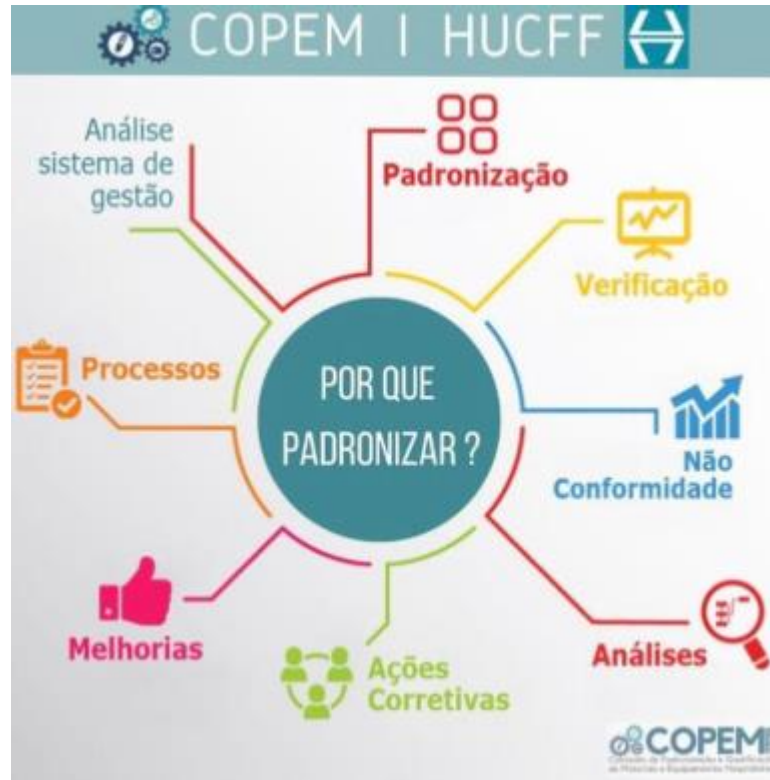
Figura 3: Exemplo de arte postada nas redes sociais da COPEM