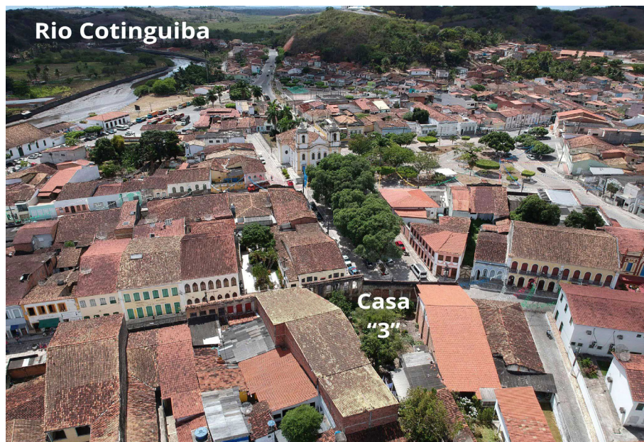
Il. 1: Localização das ruínas da casa "3" no centro histórico de Laranjeiras-SE.

possibilidade de pôr em prática uma sistemática de trabalho arqueológico que realmente pudesse contribuir com os estudos prévios às intervenções no bem arquitetônico, em detrimento das nossas clássicas atuações de escavações de solos dissociadas da edificação. (Il. 1)