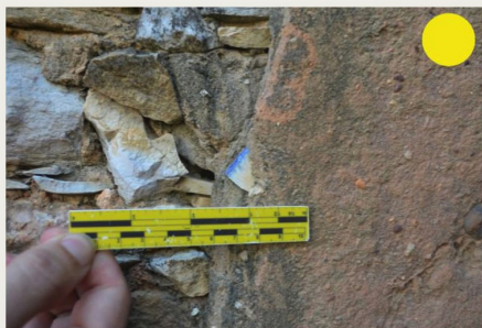
Il. 3: Exemplo de registro de duas unidades estratigráficas (solo e parede) com síntese das informações respectivas.

Fonte: Relatório final IPHAN. Autores: Pedro Freitas e Ton Ferreira.