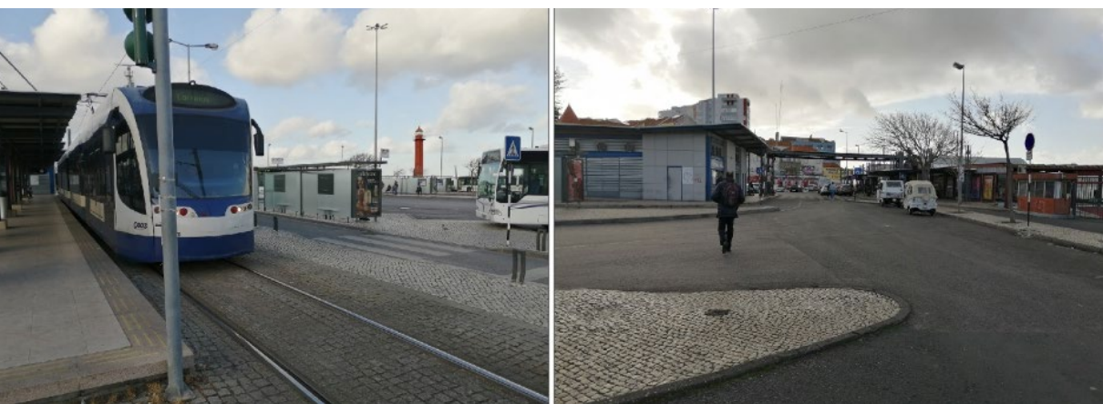
Il. 2: Área intermodal: à direita estação das barcas, à esquerda estação de ônibus e metrô.

É na faixa plana que está localizada a área intermodal que concentra a estação das barcas, a estação de metrô e a estação de ônibus (Ilustrações 1B e 2). Esta área é um espaço livre de edificações junto ao Rio Tejo, que foi aterrado e estruturado para atender a circulação da população. Observa-se que o aterro é o grande impacto ambiental desta área, pois é um espaço livre impermeabilizado e com pouca vegetação. Não há corpos d'água naturais nesta área, apenas a drenagem de águas pluviais. Em consulta à Câmara de Almada, o senhor arquiteto Luis Bernardo, Chefe da Divisão de Instrumentos de Gestão Territorial e Planejamento, informou que existe um projeto de intervenção paisagística para esta área, no qual a estação do metrô é recuada em direção à Avenida 25 de Abril de 1974.