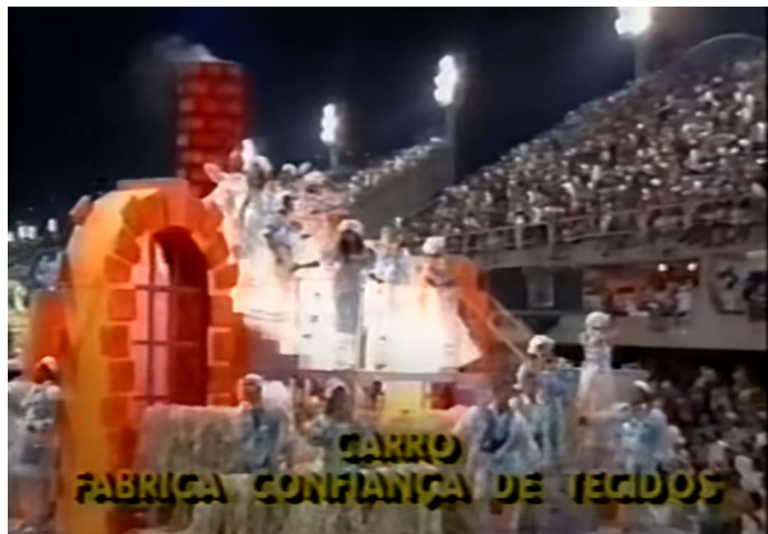
Il. 3: Captura do vídeo “Desfile de Vila Isabel 1994.

Segundo a carta de Nizhny Tagil, a adaptação e reutilização de edifícios industriais evita o desperdício de energia e contribuiu para o desenvolvimento econômico de regiões muitas vezes afetadas pelo declínio das indústrias. A Fábrica Confiança, por exemplo, passa hoje pela sua segunda reutilização. Ao final dos anos 1970 se tornou um shopping e hoje é um mercado. Tendo ficado fechada por mais de quinze anos, sua reabertura não apenas ajudou e fortaleceu o comércio na região como também cooperou na segurança das redondezas. Conforme essa nova forma de ocupação indica, uma cidade que tem seus espaços ocupados e aproveitados torna-se mais segura para todos. (Il. 3)