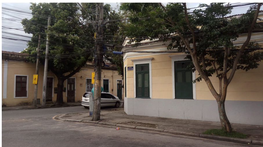
Il. 4: Esquina das Ruas Senador Soares e Araújo Lima.

Segundo Tilley (1997) a especificidade de um lugar é um elemento essencial para a compreensão do seu significado. Em suma, o espaço não teria uma essência substancial em si, apenas um significado relacional, criado por meio das relações entre povos e lugares. Apesar de ser construído por diferentes grupos e indivíduos, o espaço não tem uma essência universal. Ele depende de quem o está experimentando e como. A experiência espacial, conforme aqui assumida não é inocente e muito menos neutra, mas investida de poder em relação à idade, sexo, posição social e relacionamento dos indivíduos e grupos.