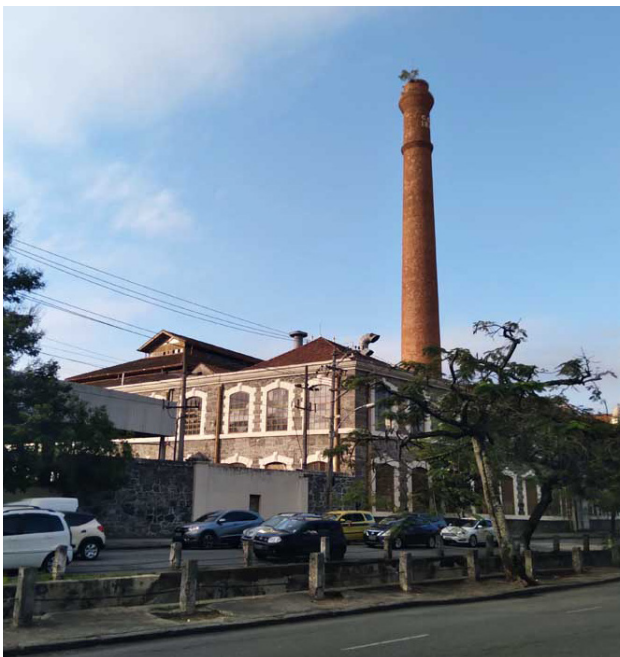
Il. 2: Antiga Fábrica Confiança, vista da Rua Maxwell, 2022.