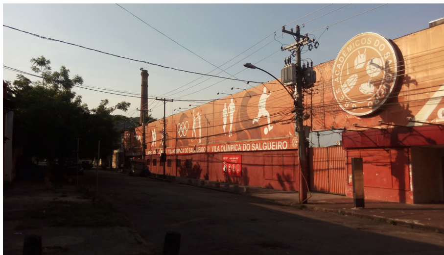
Il. 5: Quadra do Salgueiro, à Rua Silva Telles, Andaraí, 2022.

materialidade, afinal, “os sentidos dependem da materialidade e do caráter físico do mundo. Em outras palavras, os sentidos são o meio pelo qual a materialidade produz a recordação e a memória”(Hamilakis, 2016, p. 23).