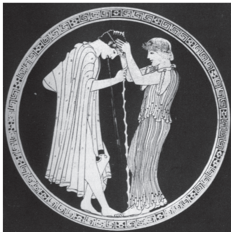
Idem à Figura 3.