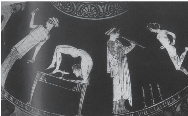
Idem à Figura 1.

Entendemos que, a despeito do que diz Eva Keuls, 14 sem sombra de dúvidas se trata de uma cena representando o treinamento de cortesãs, pois as filhas legítimas dos atenienses aprendiam a cantar e a tocar principalmente com fins religiosos e, normalmente, longe da presença dos homens; já as meninas da cena, evidentemente, treinam práticas de entretenimento.