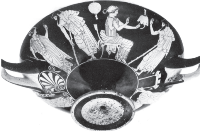
Idem à Figura 11.

Segundo Sian Lewis, a imagética que traz representações das cortesãs com sacolas de dinheiro, longe de degradante, pode ser considerada positiva para essas mulheres (LEWIS, 2002, p.197). As cenas que encontramos nesses vasos não remetem a simples transações de troca de dinheiro por sexo, mas imagens de negociação, simulando uma espécie de corte. A temática gira em torno da concordância ou não da mulher. A partir de tal perspectiva, o vaso pode ser entendido como uma representação do poder exercido pelas cortesãs, captando o momento em que ele se manifesta de forma mais clara.