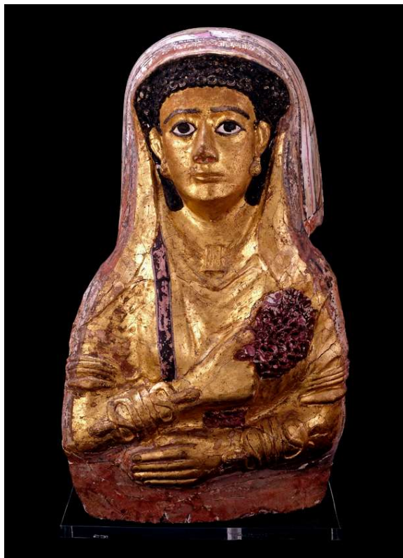
Figura 3 Máscara de múmia de Afrodite