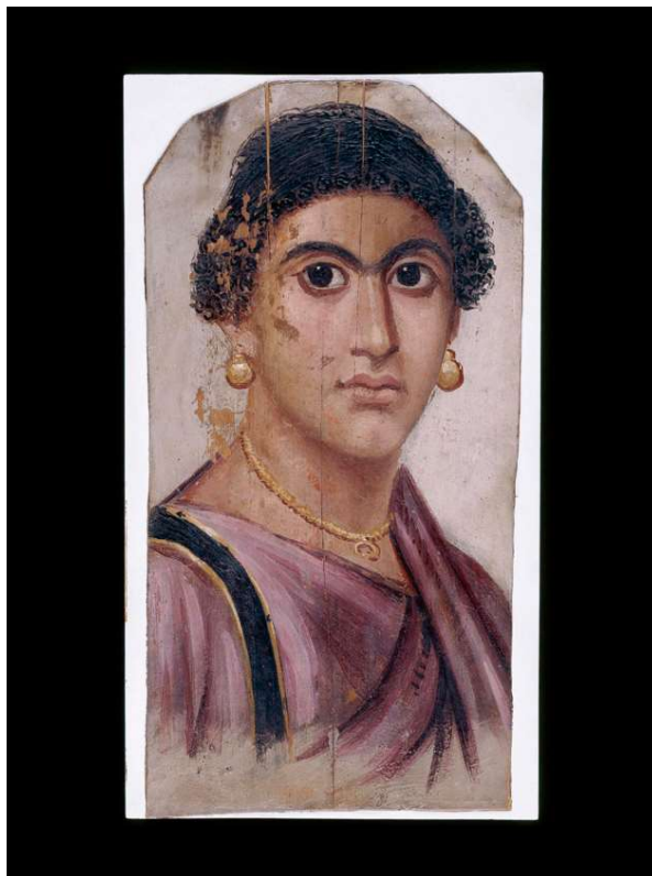
Figura 4 Retrato funerário