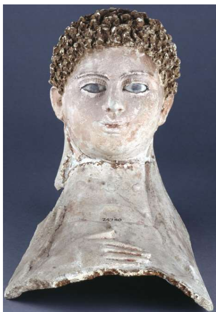
Figura 5 Máscara de gesso