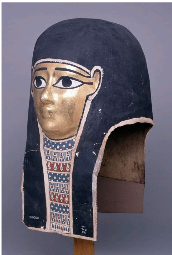
Figura 1 Máscara de múmia