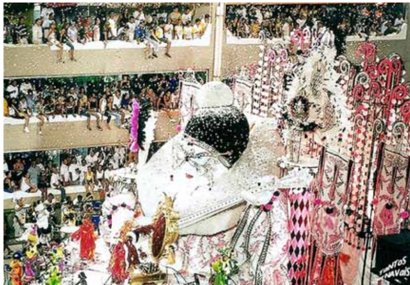
Figura 3: Tocando alaúde, sob uma chuva de papel picado, o romântico pierrô do Sodade do Cordão sintetiza a figura carnavalesca em meio a outros elementos que evocam a alegria dos dias de folia.

Nesse aspecto, é emblemática a utilização de copos descartáveis para a composição da gola rufo da escultura e do pompom do gorro do pierrô na alegoria “Sodade do Cordão”. Na dimensão hiperbólica da Avenida, ao nos afastar do objeto, mal percebemos que esses objetos triviais do cotidiano foram utilizados, tornando-se, à distância, uma camada indefinida de adereços. Mas ao aproximar a visão, percebe-se que os elementos gola rufo/pompom foram feitas de copinhos de plástico, proporcionando um efeito visual surpreendente.