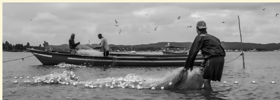
Pesca, 2019.