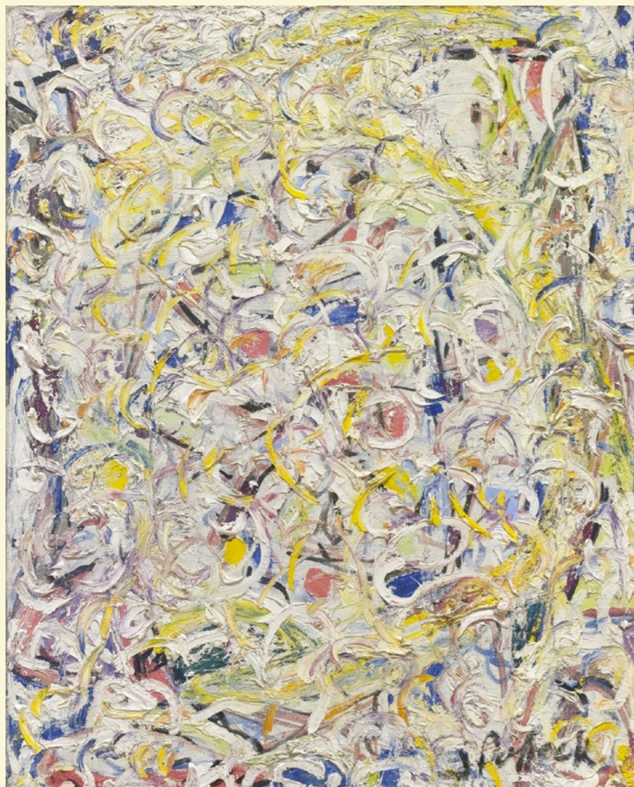
Jackson Pollock (1912-1956) Shimmering Substance , 1946.

Publicação indexada em: Latindex Portal de Periódicos da Capes IBICT Base Minerva UFRJ Portal de Revistas da UFRJ