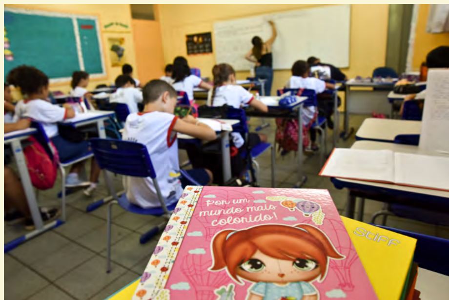
Escola Estadual EC 204 Sul.