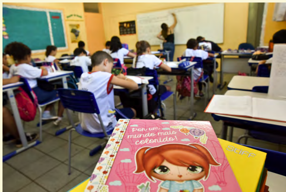
Escola Estadual EC 204 Sul.