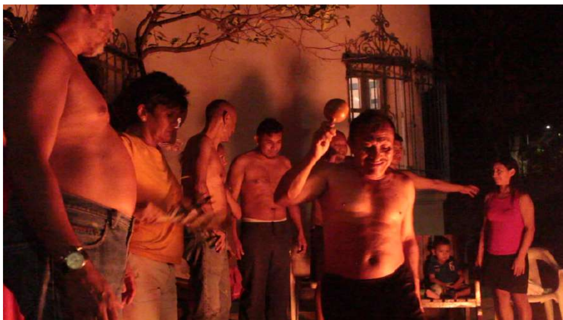
Imagen 3: Ritual Kariña – Casa Amerindia – Caracas. Fotografía Autor. Eleguá – Grupo Omo Ara, Matanzas, Cuba – 2014. Fotograma de Video Inés Pérez-Wilke

En ese contexto, vemos que la palabra improvisación una vez mas no forma parte del vocabulario local, pero el hecho de responder y componer en tiempo real es asumido como evidente y lógico, ya que es la única manera de actuar adecuadamente en relación con las circunstancias en las que se debe intervenir. Para ello la persona se prepara en la identificación y manejo de fuerzas, de espíritus, de sustancias, de tipos de personas, conoce la fuerza y el peso de las palabras, cómo balancear el sentido, argumentar y danzar en favor del enfermo cuando ocurra el encuentro con lo desconocido. Esto opera de manera parecida en encuentros colectivos, donde puede o no haber enfermos, o se realiza como ceremonia de armonización individual y colectiva, Allí la acción oscila entre invocaciones a lo colectivo y la acción y las palabras específicas dedicadas a cada persona. Estas prácticas también viven una etapa de reivindicación, incluso en espacios urbanos (Imagen 3).