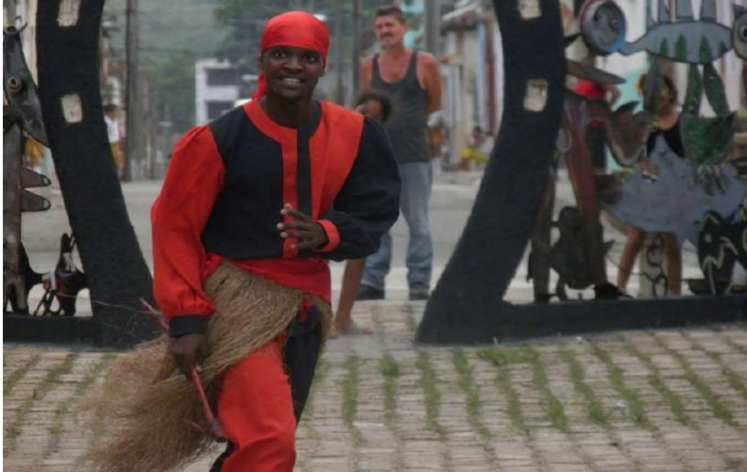
Imagen 1: Eleguá – Grupo Omo Ara, Matanzas – Cuba.

Brasil, por ejemplo, pero situaciones similares pueden darse en el culto de María Lionza 6 , son prescripciones dadas a la interpretación de las y los practicantes que ellos leen y responden en un campo libre de diálogo con lo imprevisto.