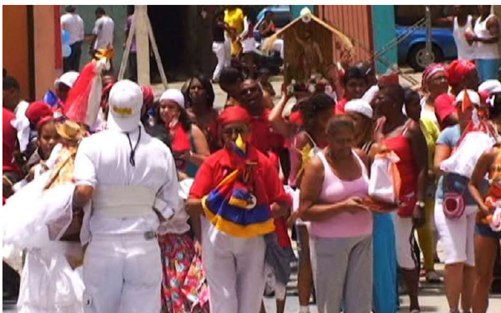
Imagen 2: Fiesta San Juan, San Agustín, Caracas – 2012.

Otro ejemplo de bailes de pareja en contextos urbanos y de alta circulación mundial es el tango. No hay unidad en las conversaciones con practicantes de tango en Uruguay, en Argentina y en otros países donde este baile ha circulado, en torno a la presencia de la improvisación. Esto se debe en parte a que la alta circulación ha demandado de códigos más estandarizados, tanto porque, las tendencias ciertas tendencias tradicionalistas se apegan al acervo coreográfico. Sin embargo, vemos una corriente, reconocida dentro del tango argentino, donde como en casos anteriores, la dimensión imprevisible se da por hecho, sin necesidad de conceptualizarla. Es decir que se asume que el baile no son los pasos, sino principios del manejo del peso compartido, en la circulación colectiva en la sala, de una intención comunicativa de la mirada y del gesto, a partir de los cuales la danza se desata y donde justamente eso que se busca es el juego y la sorpresa. Vemos que la práctica improvisada responde sobre todo al contexto popular de la milonga 7 y de los salones de asiduos aficionados, donde se cultiva el juego libre, la improvisación en pareja y el baile en colectivo. En el contexto del tango profesional, es predominante la aparición de rutinas y la construcción de formas coreográficas para espectáculos.