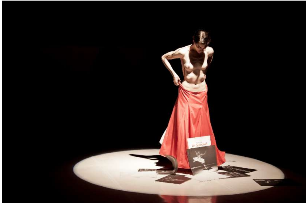
Imagen 2: Obra: EIR; Dirección: Marina Sarmiento; Fotógrafa: Mariana Roveda; Año: 2013.

al gesto 7 . Es una fuerza que habla de un estilo de danza claramente expresivista, pero también de una identidad femenina potente, poseída por la acción, emergente de la sociedad convulsionada que caracterizó a la Argentina de los años sesenta y principios de los setenta.