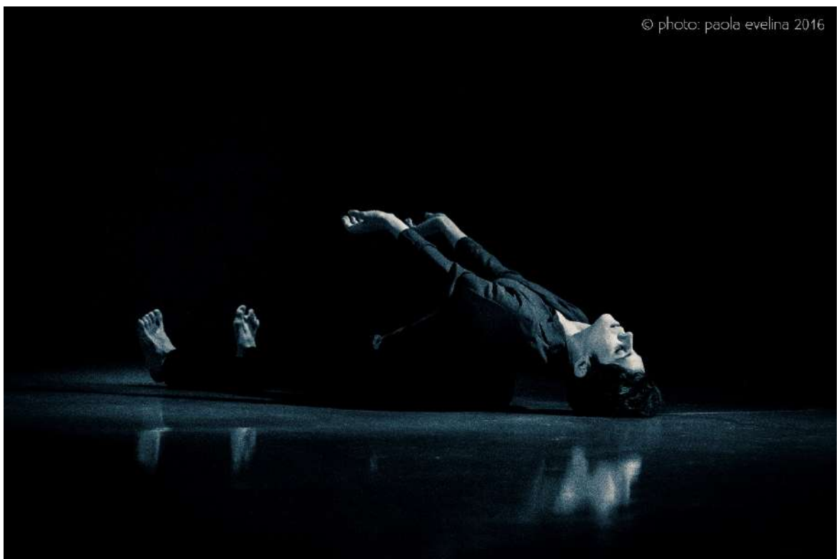
Imagen 3: Obra: María sobre María ; Dirección: Lucía Llopis; Año: 2016.

propia teatralidad completamente ajena a las prácticas coreográficas de Fux. Asimismo, una de las preguntas que quedan flotando en el aire es la referida a la militancia política de Fux en el Partido Comunista argentino a principios de los sesenta, documentada implícitamente por su presencia en la revista Hoy en la Cultura vinculada al partido. Ambas obras escenifican un intento de acercamiento al pasado que no puede evitar una cierta incompletitud. El trabajo de reenactment se renueva o se provincializa dando lugar a la exhibición de un hiato histórico, un gesto que no nos devuelve el pasado objetivado, sino que nos confronta con las dificultades inherentes a su abordaje.