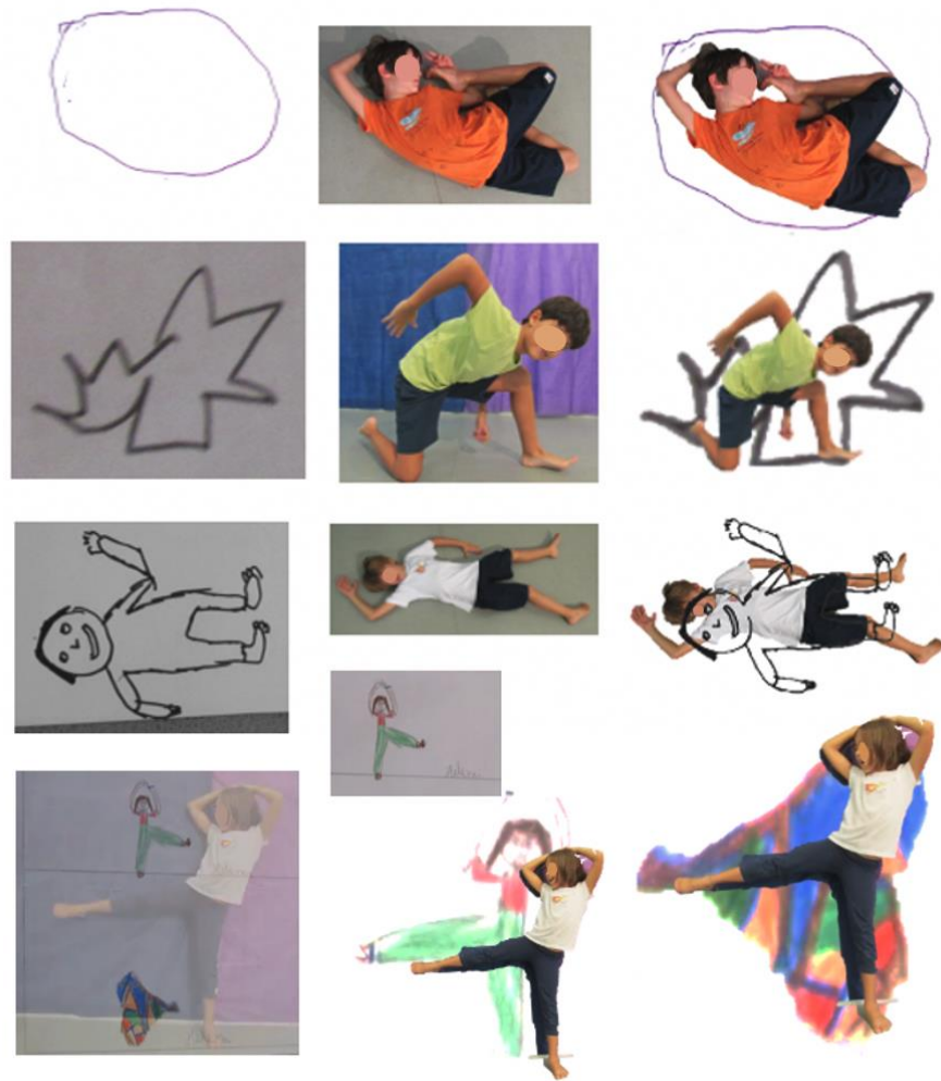
Figura 8 – Montagem com desenhos e fotografias da atividade Corpo Mineral .