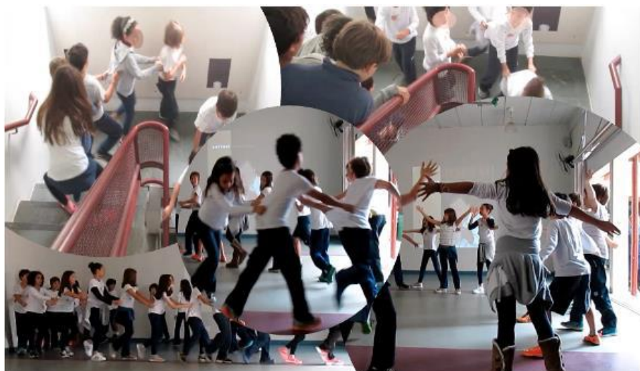
Figura 3 - A brincadeira do trem.

Essa abordagem considera o uso dos computadores e tem em si um tom liberal no sentido de preparar sujeitos para o mercado de trabalho, o que não correspondia diretamente aos meus interesses no trabalho de dança na educação. Tinha claro que o trabalho desenvolvido não estava direcionado, por exemplo, para a formação profissional de dançarinos digitais ou com habilidades em computação. No entanto, a citação de Lévy foi elencada porque sugere que o êxito de um coletivo está vinculado a uma capacidade que deve ser desenvolvida no âmbito social: a de seus membros serem capazes de atuar conjuntamente, de forma eficaz, pelo entendimento da situação como um todo. Isto é como ensinar a descondicionar o corpo de agir automaticamente, com uma postura não crítica, obediente ou preconceituosa, em relação a posição hierárquica dos indivíduos de um grupo.