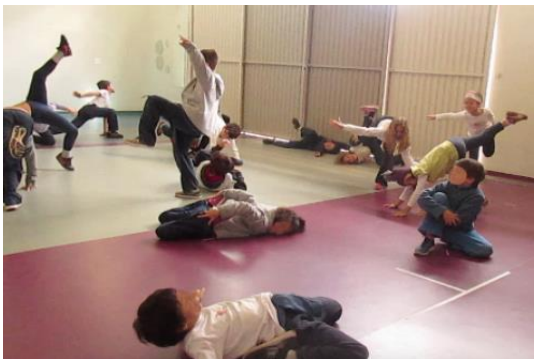
Figura 7 - Formas corporais em diferentes níveis espaciais.