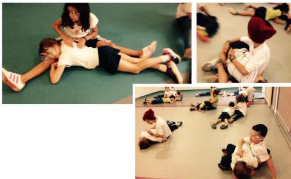
Figura 4 - Práticas de sensibilização: toque na coluna.

Ao alinhar a atenção ao próprio corpo e aos corpos dos colegas, era possível desenvolver propostas com improvisação em dança e explorar as formas corporais em diferentes níveis e dinâmicas.