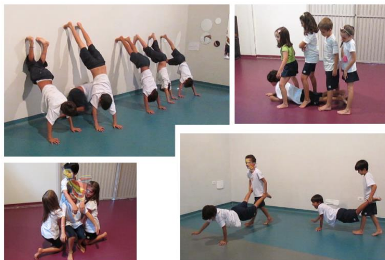
Figura 11 - Grupos no galpão apresentando suas células coreográficas.

Ao longo do semestre uma série de registros em fotos e vídeos foi feita, e, após o término, foi realizada a edição final de um vídeo 24 sobre a sequência didática “O ciclo da água no corpo” para mostrar o processo e o resultado para os pais. De forma poética, o vídeo mostra que nesse processo a pedra real virou um desenho de uma pedra imaginária, que ganhou corpos arredondados, pontiagudos, assimétricos, alongados, entre outros sem definição, mas capazes de se equilibrarem, de usarem as diagonais e tocarem o céu. Pelo audiovisual nota-se a fluência das crianças no espaço.