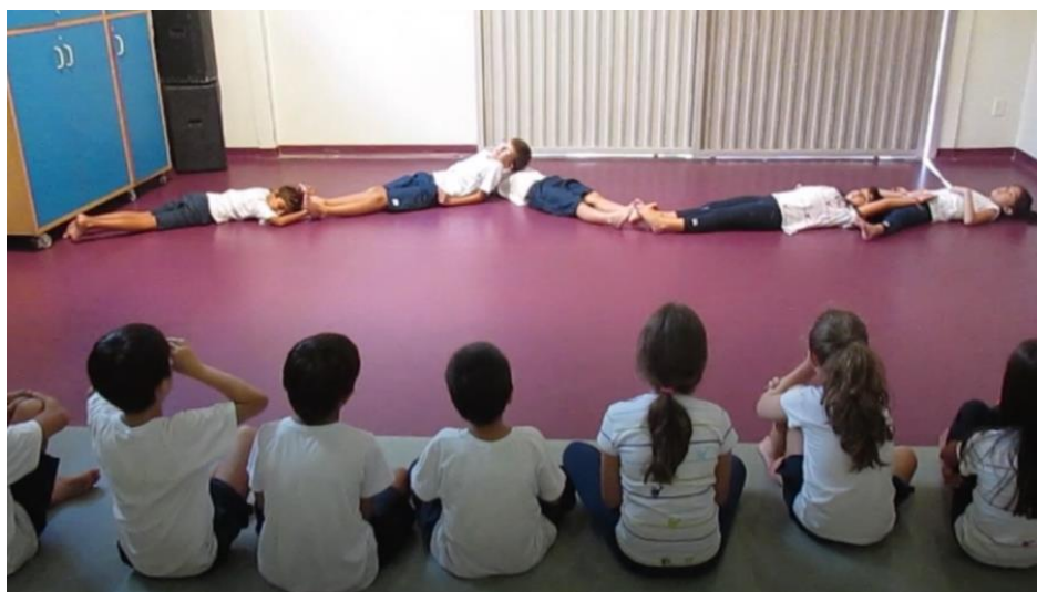
Figura 12 - Grupos no galpão apresentando suas danças para a classe.

O vídeo foi enviado para as famílias no final do semestre junto ao relato de trabalho contendo os conteúdos específicos da dança e esclarecendo os critérios dos instrumentos avaliativos que compunham a nota final da dança, dentre eles a colaboração nessa criação coletiva, a nota da prova teórica e a autoavaliação. Os nomes dos alunos aparecem nos créditos finais como intérpretes-criadores, e realmente todos os movimentos apresentados foram criações autorais das crianças.