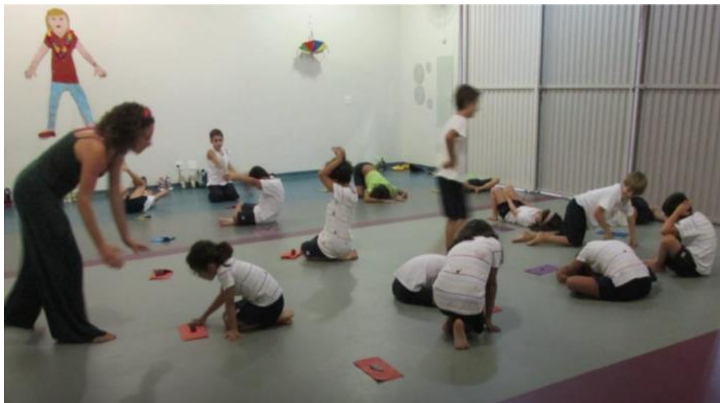
Figura 6 - Práticas de sensibilização: momento da descoberta.