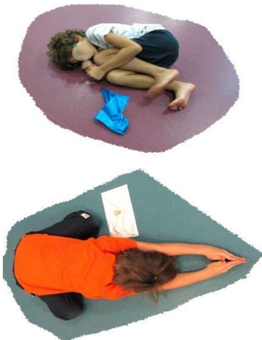
Figura 5 - Práticas de sensibilização: interpretando a forma.

Em todas as turmas, os alunos reconheciam exteriormente algo que pelo tato já lhes parecia íntimo e familiar, algo que, de algum modo, já lhes fazia parte. Sentir a forma, a temperatura, o volume e a textura das pedras, foi gradualmente conferindo significado às formas corporais imaginadas e realizadas pelas crianças durante o processo da aula.