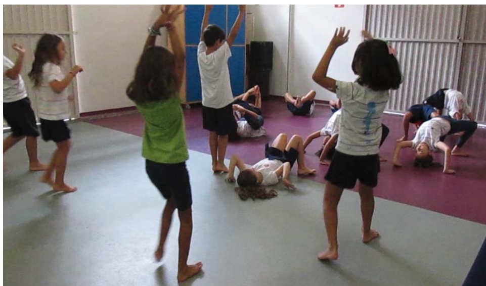
Figura 10 - Grupos no galpão durante o processo de criação.