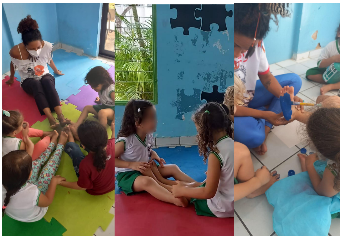
Imagem (1, 2 e 3). Registros das atividades de sensibilização, desenvolvidas na EEBAS, em 2022.

À vista disso, acreditamos que seja de suma importância pensarmos em práticas pedagógicas em Dança alicerçadas numa lógica de afetividade, que convide as crianças a momentos de aprendizado e de sensibilidade humana. Isto porque, ao nosso entendimento, essa é uma das fases importantes no desenvolvimento das pessoas, assim como são suas primeiras experiências de socialização e escolarização. Para melhor compreensão, seguem abaixo alguns registros das atividades desenvolvidas na etapa de sensibilização .