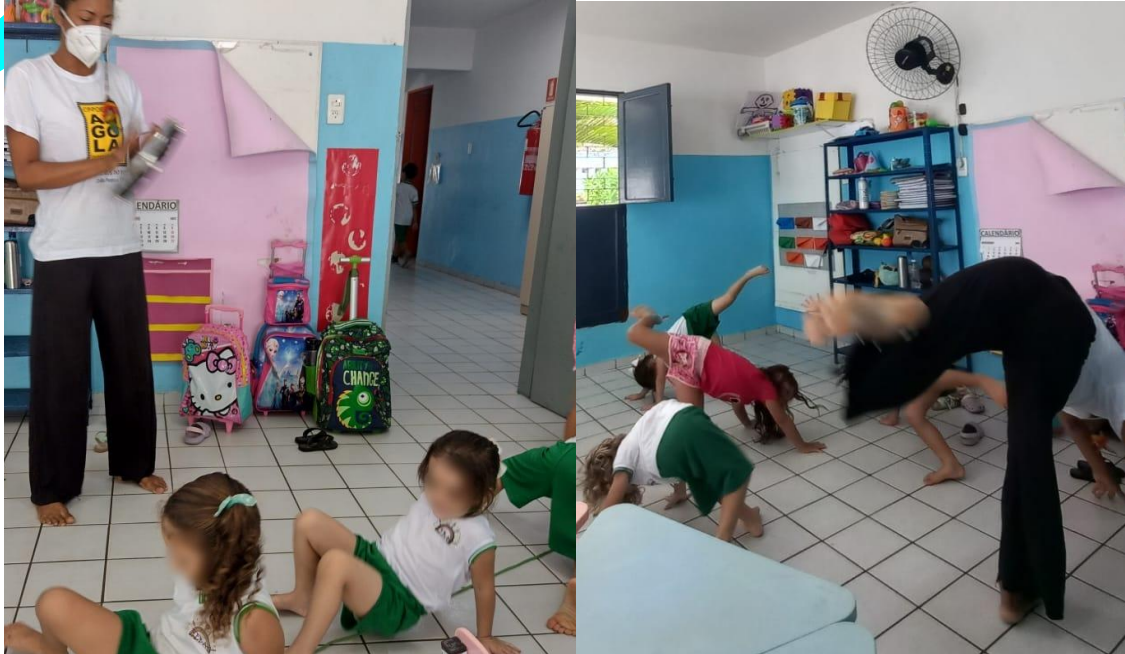
Imagem (8 e 9). Registros das práticas de Capoeira de Angola, desenvolvidas na EEBAS, em 2022.

escola com os instrumentos pandeiro e berimbau, as crianças associavam a relação batucar-cantar-dançar e logo começavam a se mover e a cantar.