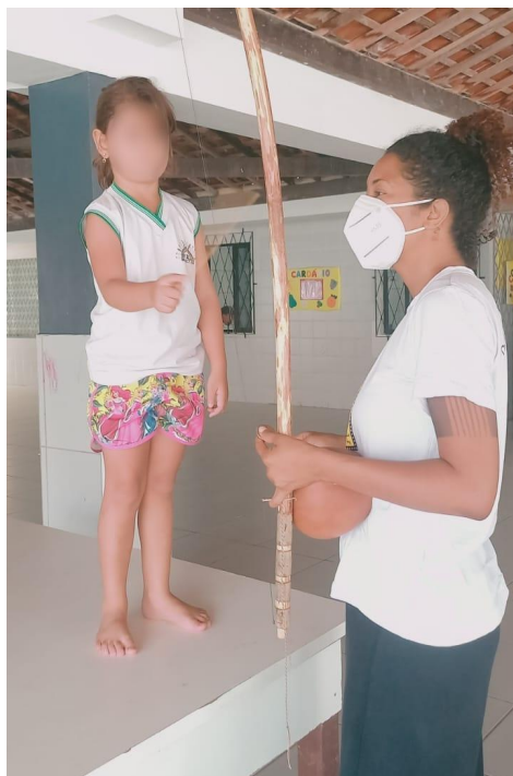
Imagem (4 e 5). Registros das práticas de batucar com os instrumentos musicais, desenvolvidas na EEBAS, em 2022.

Dessa maneira, identificamos que o Cantar é uma prática comum no cotidiano das crianças, enquanto o Batucar foi a novidade que moveu aqueles/as/is pequenos/as/es corpos/corpas/corpes em formação para as novas possibilidades criativas. As crianças foram convidadas a investigar cada instrumento, experimentando os diversos formatos, sons e possibilidades de criações. Desconstruir, criar e recriar: foi nessa estrada que os costumes afrodi-aspóricos atravessaram o universo das crianças com sabor de satisfação, novidade e alegria.