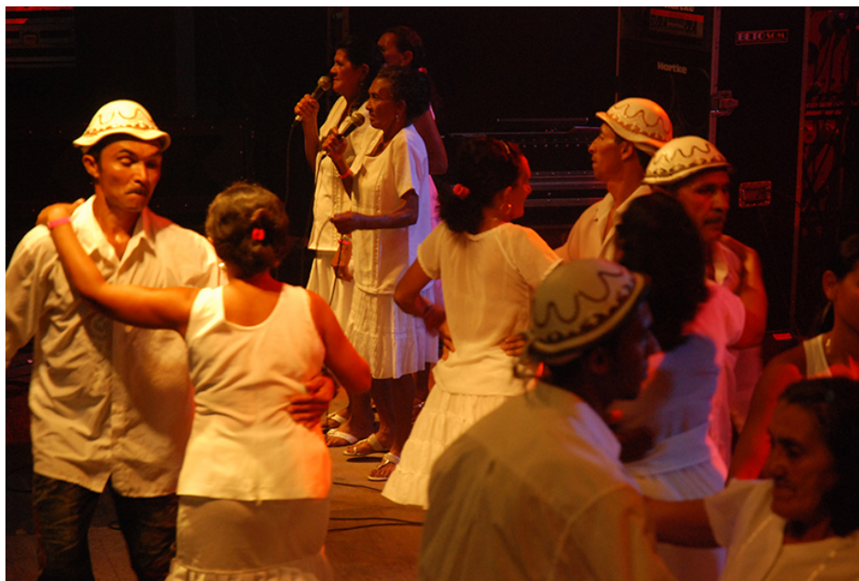
Fig. 2. TEBEI. Frame do documentário curta-metragem. Direção: Gustavo Vilar, Hamilton Costa, Paloma Granjeiro e Pedro Rampazzo. Produção: Sambada Comunicação e Cultura. 1 vídeo (21 min 22 seg). Formato HD. CurtaDoc, 2008. Disponível em: https://curtadoc.tv/curta/cultura-popular/tebei/ .

Outra cena do documentário, mostra a apresentação do grupo em um evento público, representado na figura 2.