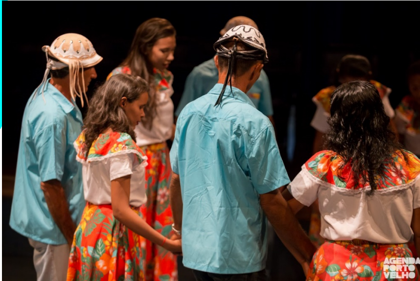
Figura 4. Coco de Tebei. A dança é ritmada pelas pisadas no chão. Registro feito durante a apresentação no Programa Sonora Brasil do SESC, em 2017, na cidade de Porto Velho. Publicada no portal digital Agenda Porto Velho.

Nas fotos pode-se observar que as duplas se apresentam em trajés combinados. As mulheres aparecem em saias de chita em tons vermelhos, amarelos e laranjas coloridas e estampadas de flores coloridas grandes e folhas verdes. A altura da saia encosta na canela. As blusas são brancas de tecido de alfaiataria com babados de chita combinando com as saias. Nos pés, a sandália rasteira é decorada de estampas aparentemente de aves no couro na parte de trás, e na parte da frente tiras de couro vermelha com uma pedrinha de miçangas no centro. Os homens vestem calças de sarja em tom bege, camisas azuis de tecido de alfaiataria, sapatos de couro marrom, chapéu de coco de couro artesanalmente modelados. O cenário é um palco do Teatro Um, da cidade de Porto Velho e a textura da cena é construída com luzes em tons âmbar e branco, criando sombras entre as luzes e o chão do palco.