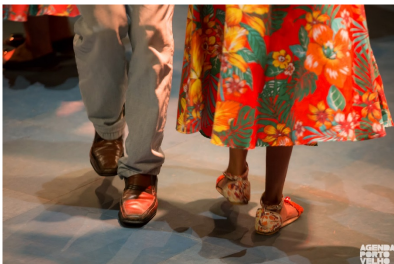
Fig. 3. Coco de Tebei. A dança é ritmada pelas pisadas no chão. Registro feito durante a apresentação no Programa Sonora Brasil do SESC, em 2017, na cidade de Porto Velho. Publicada no portal digital Agenda Porto Velho.

Nas figuras 3 e 4 que se seguem, as fotos foram feitas enquanto o grupo passava pela cidade de Porto Velho na turnê do Sonora Brasil, do SESC Nacional, em 2017.