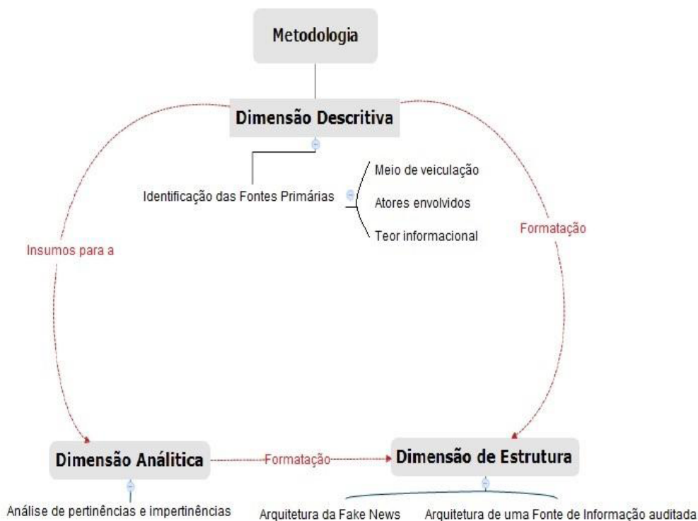
Figura 1: Dimensões de formatação