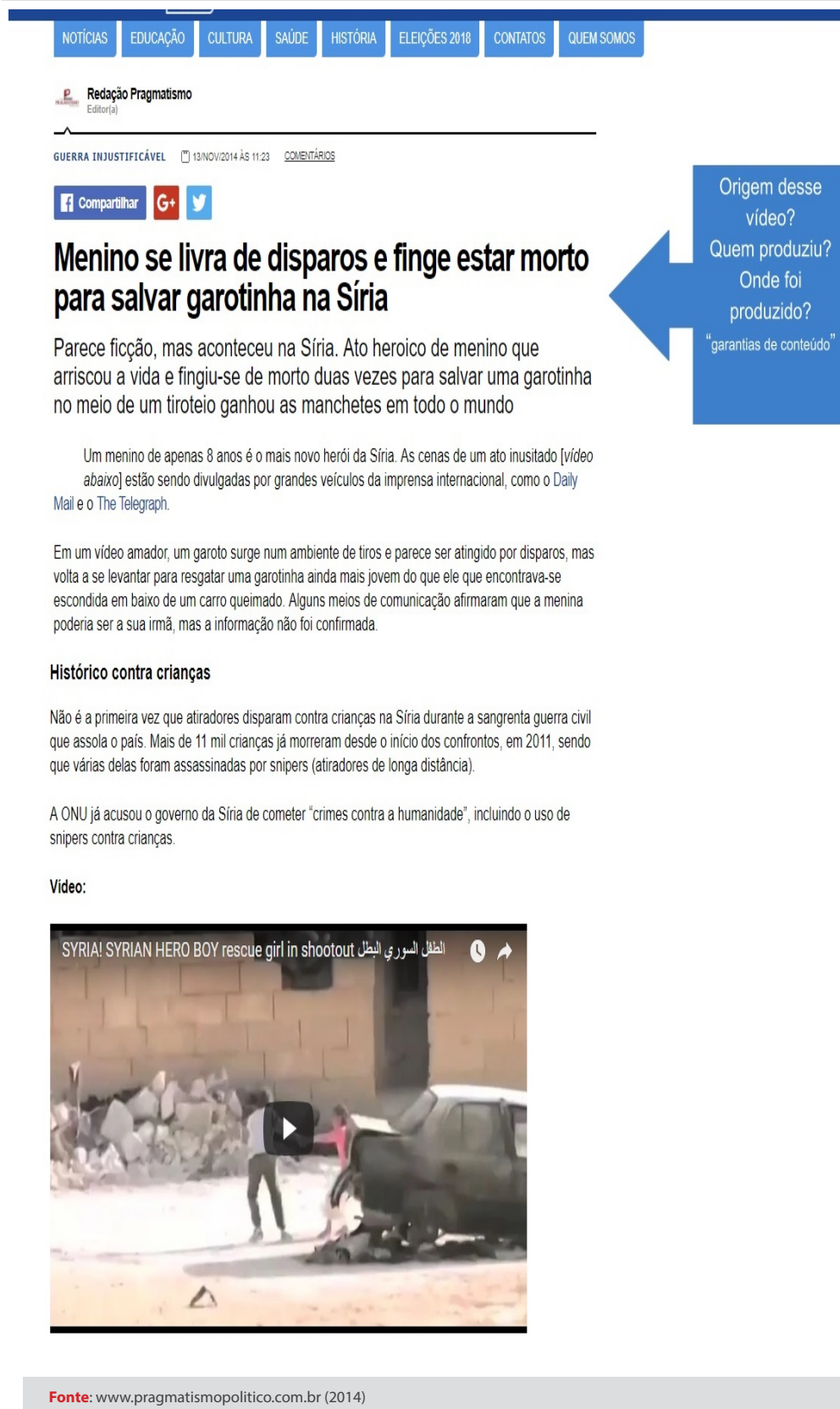
Figura 2: Notícia Número 1

Origem desse vídeo? Quem produziu? Onde foi produzido? "garantias de conteúdo"