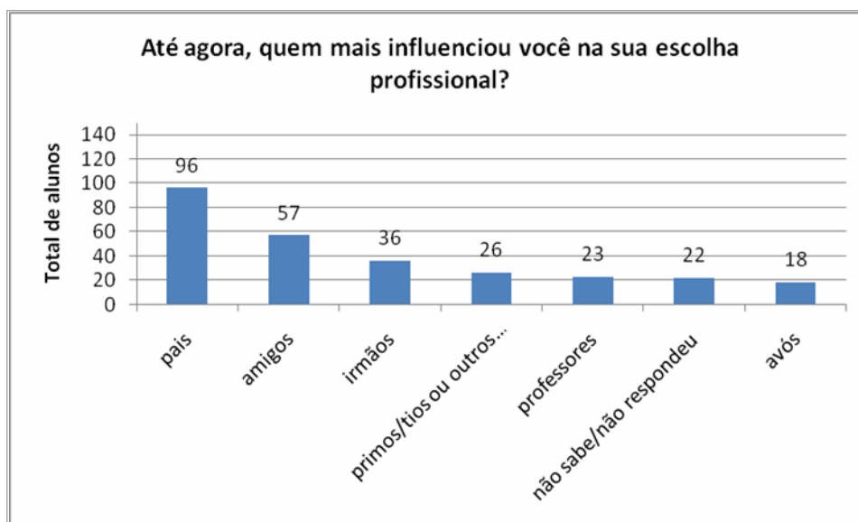
Gráfico 3: Principais influências na escolha profissional.

Fonte: COUTRIM, RME; CUNHA, MAA; ASSIS, CF; PAULA, BLS. O Papel da Família e da Escola na Transmissão de Disposições entre as Gerações: Expectativas de Futuro para Jovens Egressos do Ensino Médio. Universidade Federal de Ouro Preto/Universidade Federal de Minas Gerais, 2009/2011.