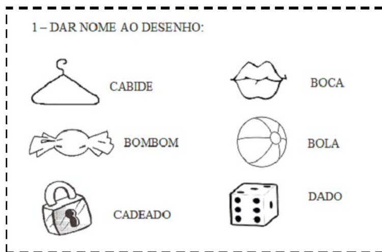
Figura 3: Atividade para averiguar nível de alfabetização, professora experiente.