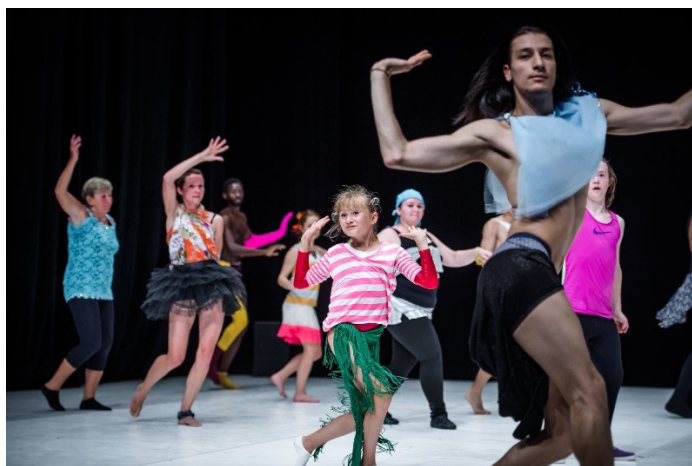
Figura 3: Gala (2015)