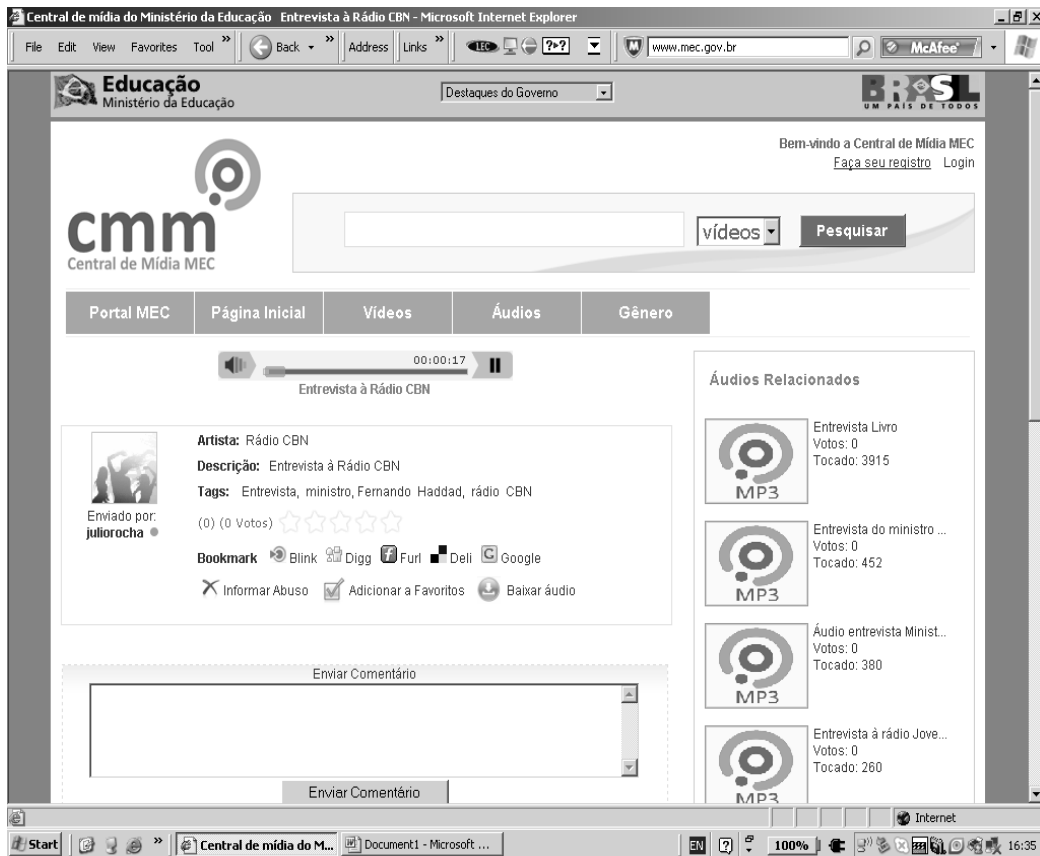
Figura 4 (Horário de navegação: 16h 35min)