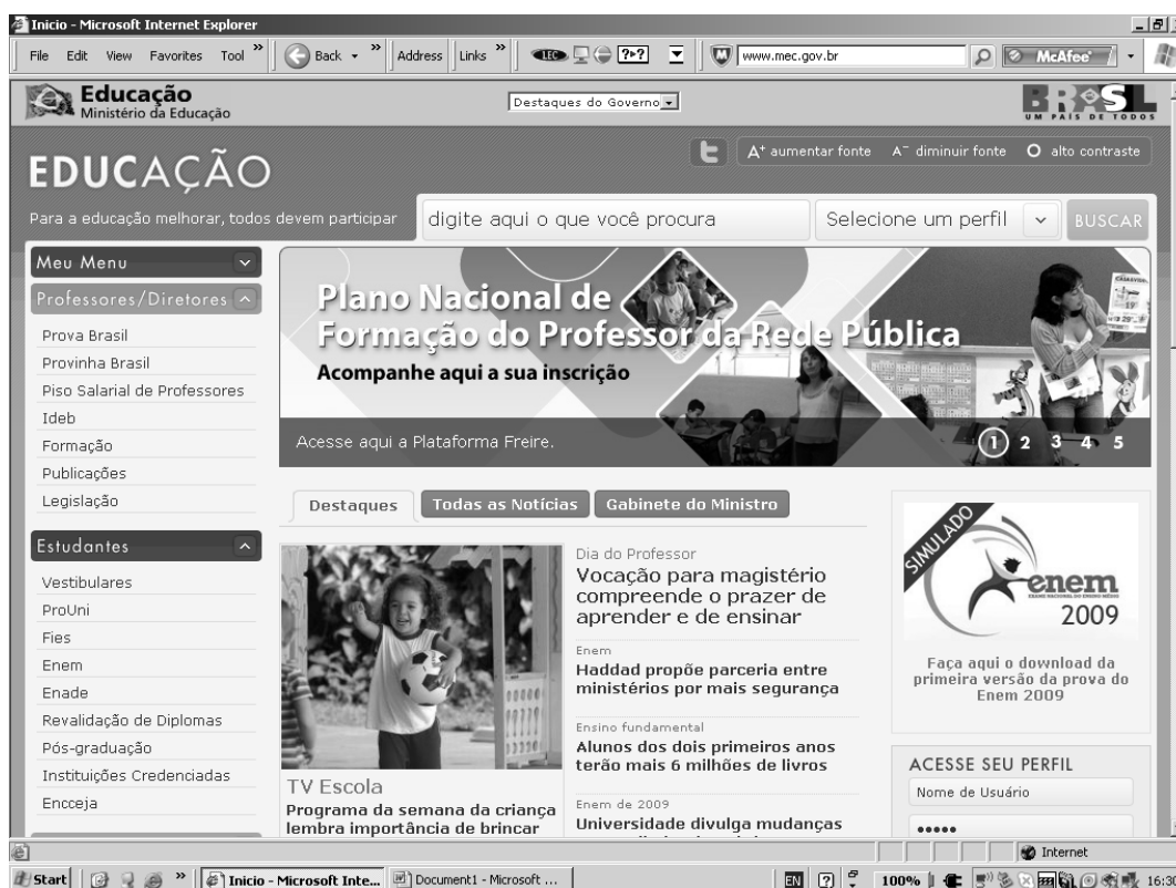
Figura 1 (Horário de Navegação: 16h 30min)

Observemos o exemplo a seguir, em que é feita a reprodução de como se deu a navegação de um internauta pela página do Ministério da Educação e Cultura em 15/10/2009. Observemos os tipos de “leituras” a que ele esteve exposto e as estratégias que precisa/precisaria ter adotado durante esse processo, para exemplificar como se dão as práticas de “leitura” e de “escrita” no suporte digital.