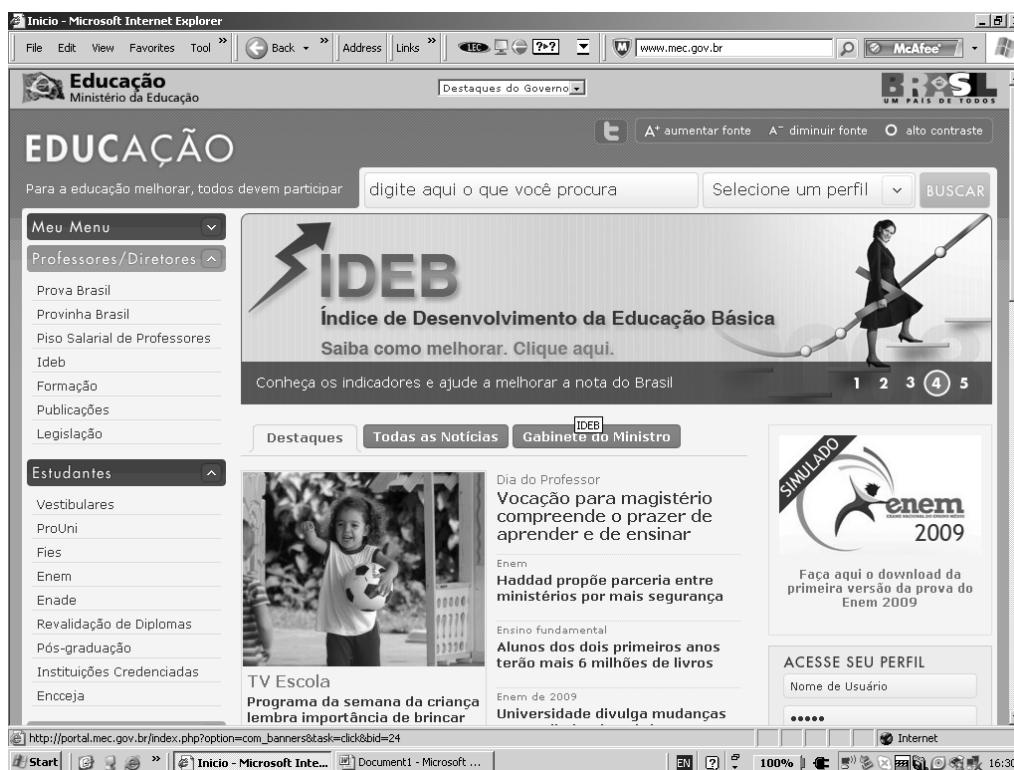
Figura 2 (Horário de Navegação: 16h 30min)

Podemos constatar, de início, uma das características da produção hipertextual: ela é colaborativa, seja na forma de produção ou de recepção. Isso significa leitura em ‘cascata ou arborescente’, conforme classifica Coracini (2005, p. 36). As práticas de leitura são, portanto, diversas das experimentadas antes do surgimento da internet como suporte de veiculação digital de textos, imagens, sons e hipertextos.