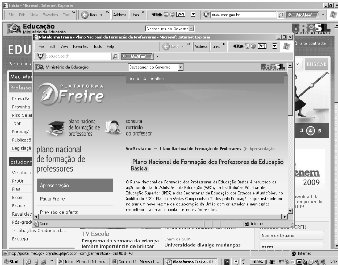
Figura 3 (Horário de navegação: 16h 32min)

internauta/leitor, para que consiga acompanhar o ritmo imposto pela/na página por que navega.