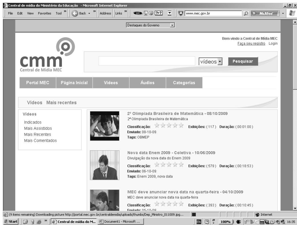
Figura 5 (Horário de navegação: 16h 35min)