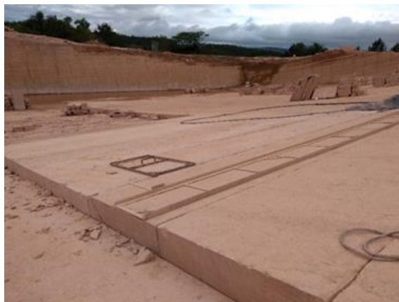
Figura 1: Jazida de arenito Botucatu

GIORDANI [22] descreve a extração de blocos do arenito Botucatu por aberturas de fendas que atingem o plano frágil da rocha por intermédios de ferramentas manuais e pneumáticas, que facilitam a introdução de alavancas e cunhas e desagregam a rocha em grandes placas. Na continuação do processo de extração, estas placas ou blocos são reduzidas para peças menores, que são utilizadas na construção civil em variadas aplicações. A Figura 1 retrata o ambiente da exploração em uma jazida de arenito no vale do Paranhana.