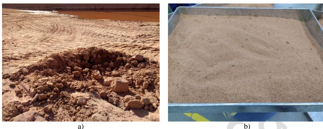
Figura 2: a) Resíduos recolhidos na jazida e b) aspecto após secagem em estufa

cilitar o andamento do presente estudo foram escolhidos resíduos de dimensão semelhante ao agregado miúdo, os quais necessitaram de secagem preliminar, devido ao alto teor de umidade. A Figura 2 demonstra a condição encontrada dos resíduos na jazida (a) e os mesmos após secagem em estufa (b) a 105°C, por 72 horas.