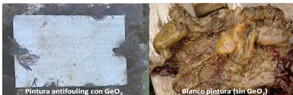
Figura 1: Paneles de acrílico luego de 120 días de inmersión en el puerto de Mar del Plata.

Los resultados obtenidos indican claramente que las pinturas conteniendo dióxido de germanio afectaron la fijación de especies conspicuas del fouling del puerto de Mar del Plata (Figura 1).