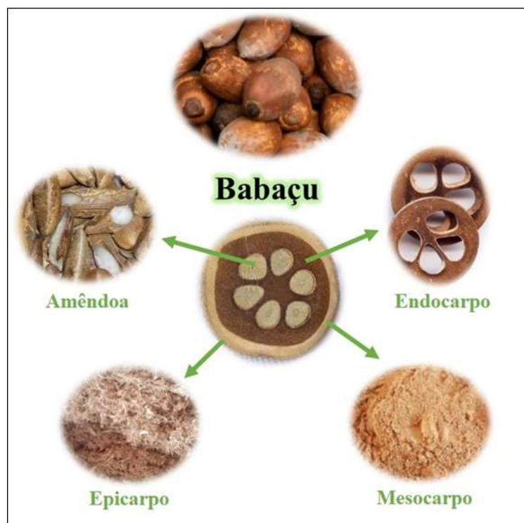
Figura 1: Coco babaçu e seus componentes.

O babaçu é uma planta nativa do Brasil, disseminada por quase todo o interior do Brasil, desde o estado do Amazonas até o estado de São Paulo. Contudo, são nos estados do Maranhão, Piauí, e algumas áreas isoladas no Ceará, Pernambuco e Alagoas, onde se localizam as principais ocorrências dessa palmeira. Tendo o fruto composto por partes distintas (Figura 1). O Epicarpo é a camada externa do fruto do babaçu, possui estrutura fibrosa, corresponde a 12% do fruto e apresenta cor amarelo-avermelhada. O Mesocarpo é camada abaixo do epicarpo, corresponde a 23% do fruto, tem aspecto farinhoso e é rica em amido. Dependendo do grau de maturação do fruto, apresenta cor branco-amarelada, é a camada intermediária, com espessura de até 1 cm. O Endocarpo protege as amêndoas, é de onde se produz um carvão vegetal com alta qualidade, corresponde a 58% do fruto. Em geral, possui coloração marrom. A parte central do fruto do babaçu é composta por sementes onde cada fruto possui de três a quatro amêndoas, das quais se extrai o óleo vegetal, 7% do fruto [6].