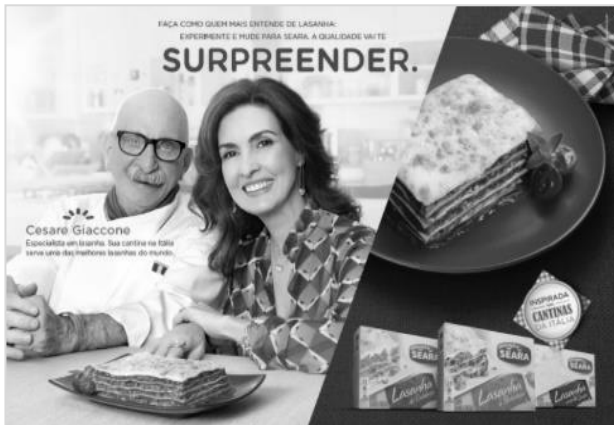
Figura 2: Anúncio Seara.

suscitar a discussão sobre o papel do endossante junto aos entrevistados e se este elemento é capaz de influenciar a adoção ou a melhorar a impressão sobre o produto. Nos últimos anos, a marca apresentou forte trabalho de reposicionamento em ataque à marca líder no segmento de alimentos (Sadia), utilizando-se do endosso da jornalista e apresentadora Fátima Bernardes, figura pública conhecida nacionalmente. A peça do laboratório farmacêutico CIMED (Figura 3) foi escolhida por trazer uma sobrecarga de imagens – crianças, medicamentos, uma pessoa em uma linha de produção, pesquisadoras em um laboratório, logotipo de entidade esportiva e logomarca, além de um pequeno texto explicativo das atividades da empresa.