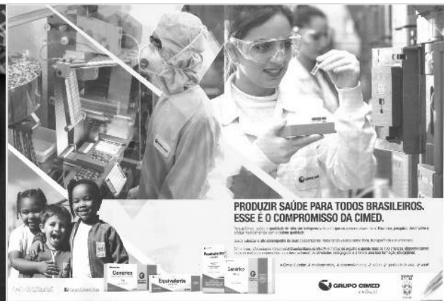
Figura 3: Anúncio CIMED. Fonte: Revista Época, 20/06/2016