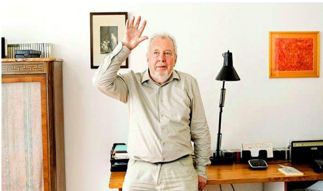
CLÉMENT ROSSET (1939-2018)

J'ai lu Clément Rosset lorsque j'étais étudiant à Paris dans les années 1980. J'ai commencé avec ses deux livres sur Schopenhauer. Grâce à ces livres je me suis beaucoup intéressé à l'homme au caniche qui s'est révélé être l'un de mes philosophes favoris. Et d'un autre côté Clément Rosset est également devenu l'un de mes amis de la pensée. J'ai à l'époque notamment lu L'anti-nature , Le réel et son double et Logique du pire .