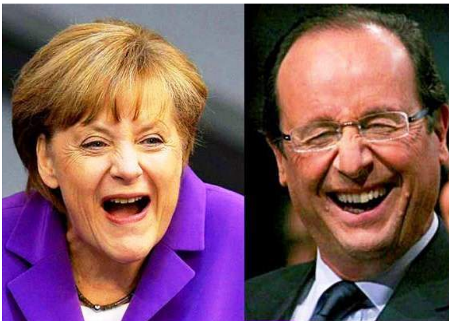
Deux Dindons de la Face

Risoto : Les grands bêtas c'est déjà moins drôle, ça ricane.