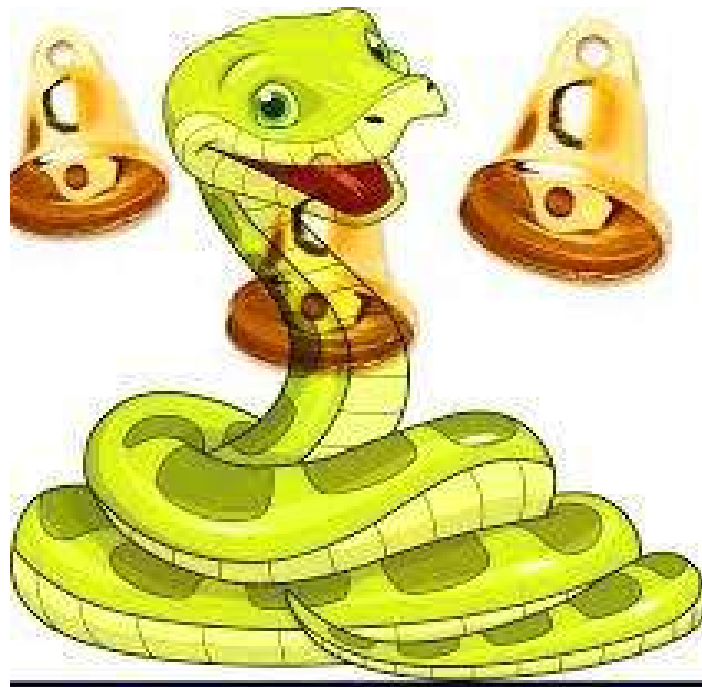
Le Serpent à Sornettes

Une histoire avec une queue et une tête, où l'on se démêle avec mille et une sornettes.