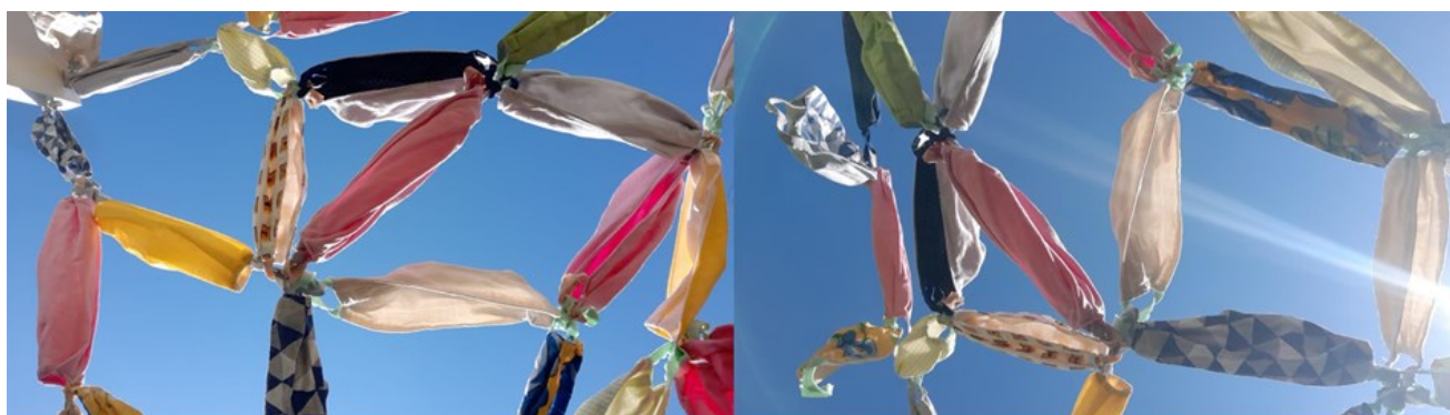
Imagem 2. Amanhecer - Por nós mulheres