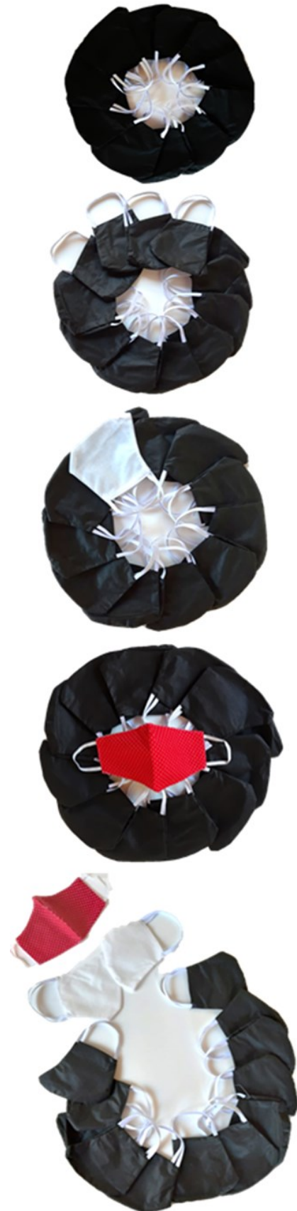
Imagem 1. Pulsar - os paradoxos que nos habitam