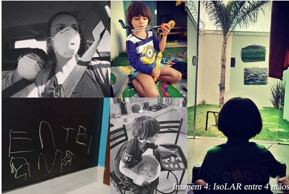
Imagem 4: IsoLAR entre 4 mãos